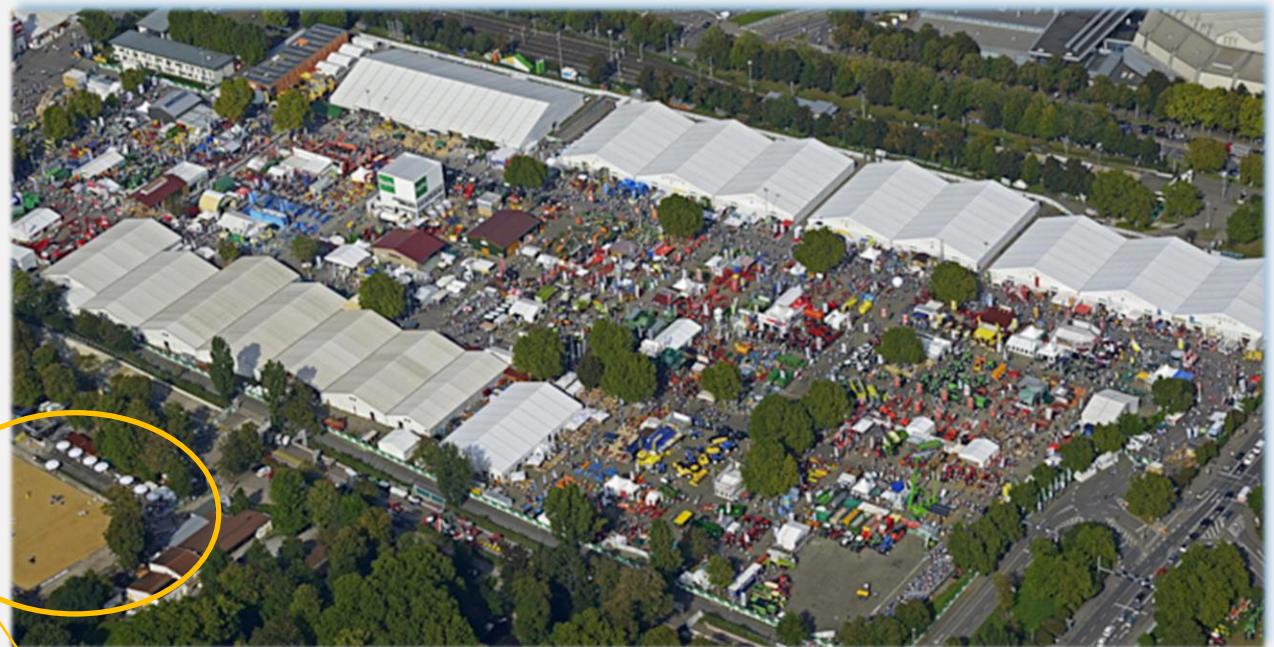
Stuttgarter Reitstadion mit Haupttribüne

Es zählen die ersten drei Stationen ohne Streichergebnisse!